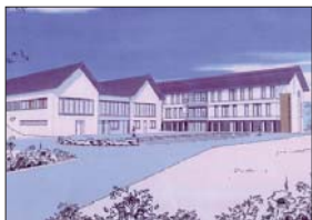
► Projet de maison de retraite médicalisée de Laignelet