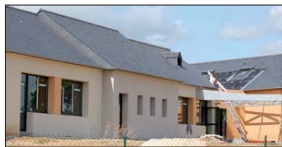
► Chantier de l'école publique de Romagné

Particulièrement attentif aux projets éducatifs d'origine communale, le député de la circonscription de Fougères-Liffré a souhaité contribuer à hauteur de 55 000 euros à la construction de l'école publique de Romagné. Ce projet de plus d'un million et demi d'euros va permettre à cette commune en expansion de se