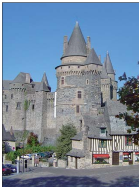
▶ Château de Vitré, Pays de la Porte de Bretagne