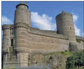
▶ Château de Fougères, Pays des Marches de Bretagne

Ces deux régions présentent un passé rural et industriel proche en plus d'une localisation commune sur les Marches de Bretagne. Autant d'éléments qui ont conduit Thierry Benoit à préconiser lors de la réforme de la carte judiciaire une mutualisation de leurs juridictions, susceptible de conduire à des économies d'échelle. Thierry Benoit a incité les Pays de Fougères et de Vitré à se rapprocher au mois de novembre 2007 afin de formuler des propositions concrètes dans ce domaine. Ces derniers ont commandé à un cabinet parisien une étude d'impact sur le préjudice occasionné par une fermeture brutale des juridictions de la moitié orientale de l'Ille-et-Vilaine. Le député de Fougères a poursuivi son action à l'automne 2007 en interpellant la Garde des Sceaux à l'Assemblée nationale, après avoir lancé une pétition à travers le Pays de Fougères.